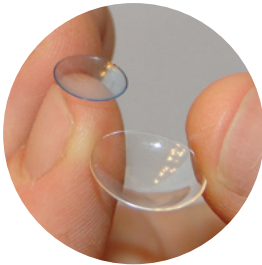
Lente GP normal (izquierda) y un lente escleral (derecha).

Los lentes esclerales son mucho más grandes que los lentes GP normales. Debido a que los lentes esclerales son de más tamaño, cubren la córnea y se apoyan en la parte blanca (esclera) del ojo. De ahí proviene su nombre. Debido a su mayor tamaño, el lente escleral se acomoda por debajo del párpado, lo que hace que el lente sea muy cómodo de usar.